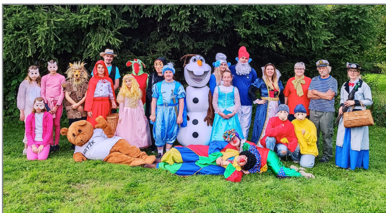
Komunitní centrum v Freedom Art v Nedvědicích