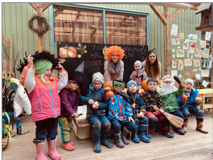
Komunitní centrum v Novém Městě na Moravě