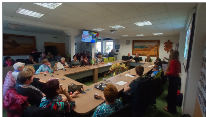
Klub seniorů v Bystřici nad Pernštejnem