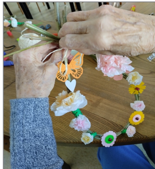
Klub seniorů v Novém Městě na Moravě