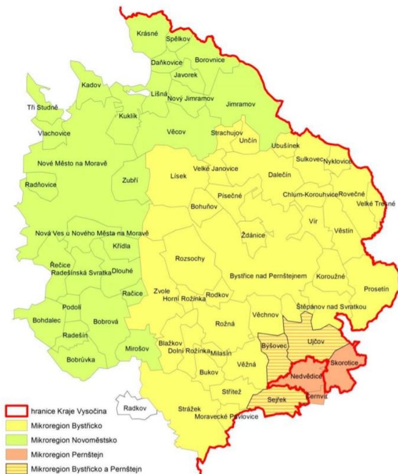
poloha v rámci krajského uspořádání MAS