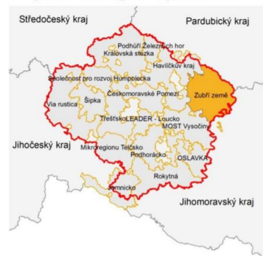
poloha regionu v rámci ČR