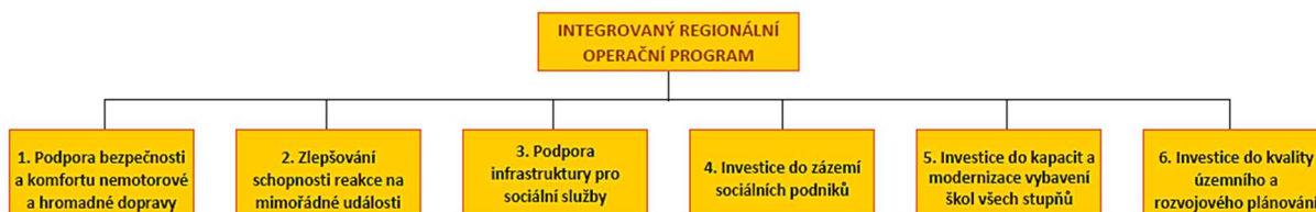
Obr. 77 Jednotlivá opatření definovaná pro Programový rámec IROP

Pro podporu aktivit v těchto specifických cílech byla definována konkrétní opatření, jejichž realizace povede k naplnění stanovených cílů. V rámci Integrovaného regionálního operačního programu bylo definováno celkem šest opatření, tzn., ke každému vybranému specifickému cíli bylo definováno jedno opatření, ta jsou zpracována dále v tabulkách. Schéma programového rámce Integrovaného regionálního operačního programu a jejich opatření znázorňuje obrázek níže.