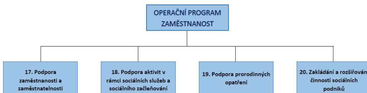
Obr. 79 Jednotlivá opatření definovaná pro Programový rámec OPZ

Pro podporu aktivit v těchto specifických cílech byla vytvořena jednotlivá opatření, která vymezují oblasti podpory pro konečné žadatele. V rámci Operačního programu Zaměstnanost byla vytvořena celkem čtyři opatření, ty jsou zpracovány níže v tabulkách. Zároveň také schéma níže, názorně ukazuje strukturu programového rámce.