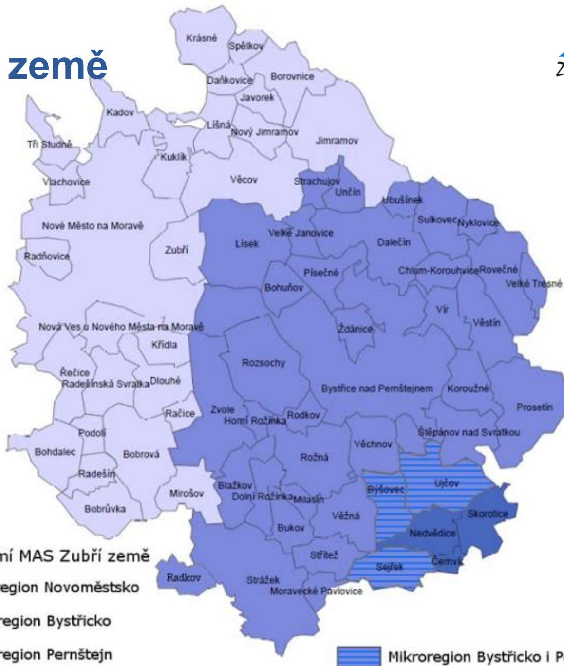
Legenda území MAS Zubří země